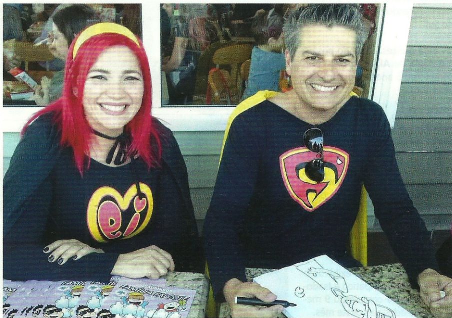
Super Mei e Super Falcote têm foco na produção cultural para o público infantil.

O trabalho pode ser adquirido nas livrarias King Box, do Shopping do Vale, em Cachoeirinha, e na SBS Livraria Internacional, no Shopping Bourbon Wallig, em Porto Alegre. Além disso, nas feiras literá-