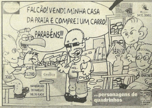
...personagens de quadrinhos