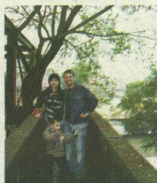
RUÍNAS do Carandirú: família foi conferir cenário de dramas, foi manchetes e virou filme