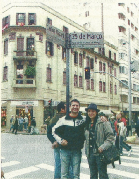
SUPER FALCOTES: na esquina da 25 de março, tradicional centro popular de compras da capital paulista

SUPER FALCOTINHO: ensaiando voos contra os caloteiros paulistas tendo a Estação da Luz como cenário.