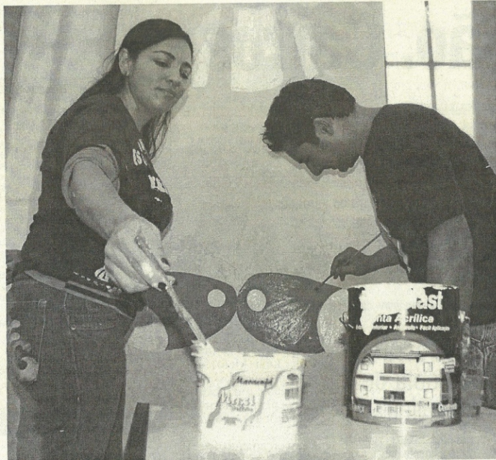
PINCÊIS > casal compra os materiais para a pintura de ilustrações nas escolas municipais