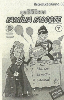
CAPA > da sétima edição