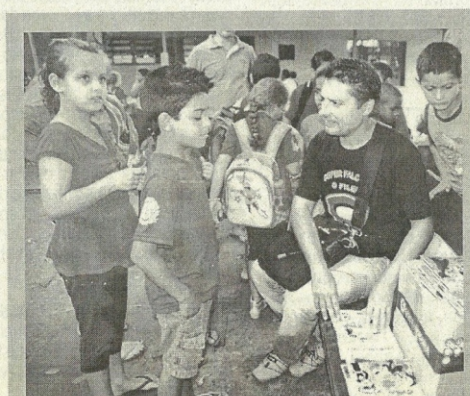
VENDAS > de revistas em uma escola para pintura em outra