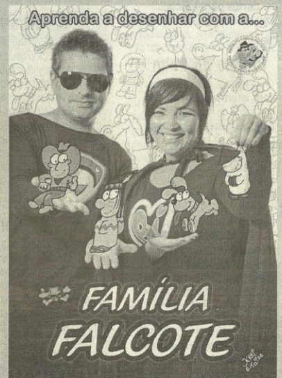
CAPA do novo DVD

“São várias boas notícias. O DVD está lindo, acredito que vai agradar a todos”